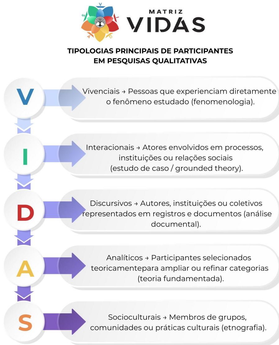
Figura 4: Representação esquemática da Matriz VIDAS.

expande em direção ao centro da experiência humana, simbolizando o movimento entre sujeito, contexto e método. As setas bidirecionais expressam a interdependência entre as categorias e a fluidez dos modos de participação qualitativa, como visto na Figura 4.