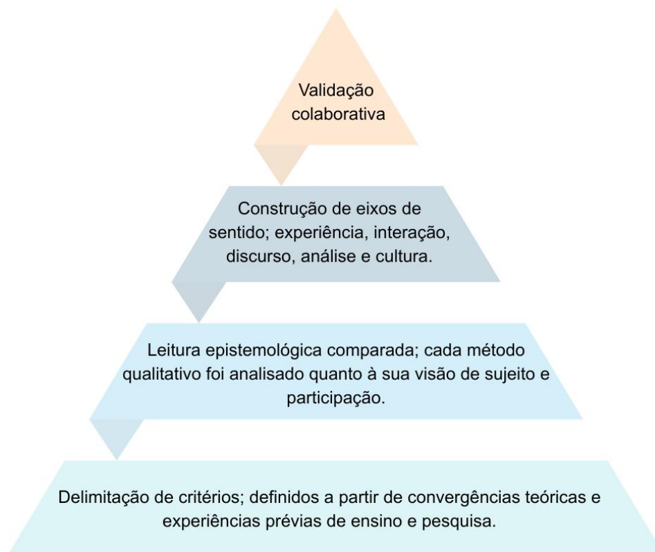
Figura 2: Definição dos critérios operacionais das cinco dimensões.