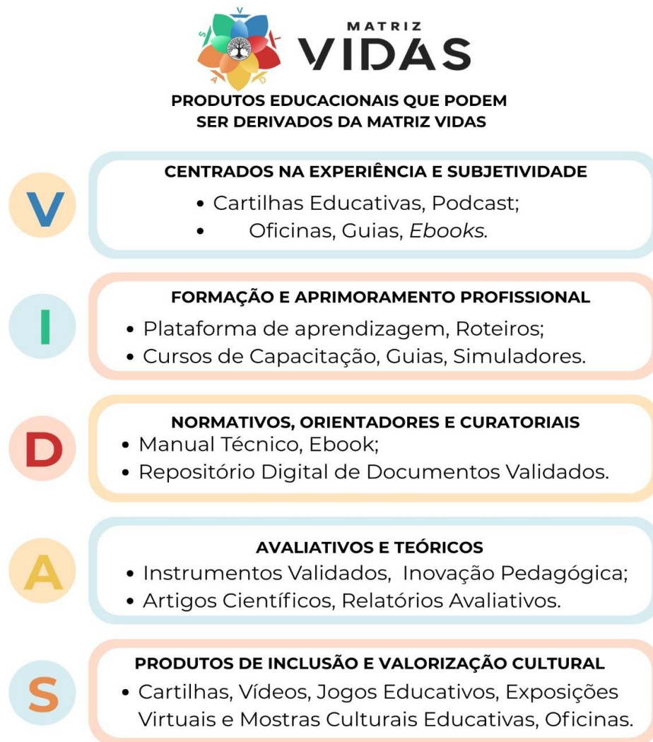
Figura 3: Produtos educacionais sugeridos pela Matriz VIDAS

Além de organizar dimensões, fundamentos teóricos e critérios de participação, a Matriz VIDAS sustenta a criação de produtos educacionais, tecnológicos e culturais alinhados às cinco dimensões, ampliando suas aplicações no ensino em saúde e na formação profissional, conforme ilustrado na Figura 3, a seguir.