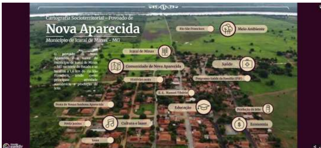
Imagem 01: Cartografia Socioterritorial de Nova Aparecida