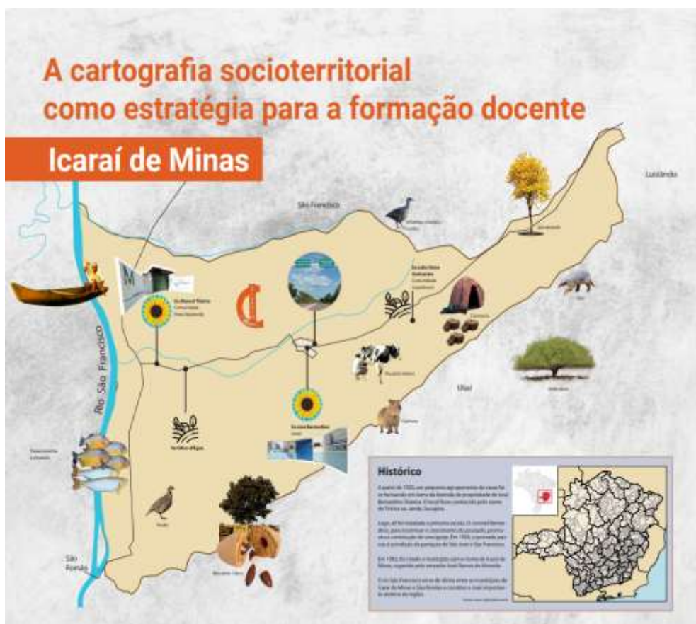
Imagem 02: Cartografia Socioterritorial de Icarai de Minas

Finalmente, no decorrer das atividades do Módulo III, foi proposta a ampliação da Cartografia Socioterritorial da comunidade de Nova Aparecida, de modo a abranger integralmente o município de Icarai de Minas. Para isso, foram considerados os dados produzidos os achados dos questionários socioterritoriais dos residentes. Nesta etapa, houve a participação de egressos da Lecampo, cujas contribuições incorporaram dados de suas respectivas pesquisas de Trabalho de Conclusão de Curso (TCC).